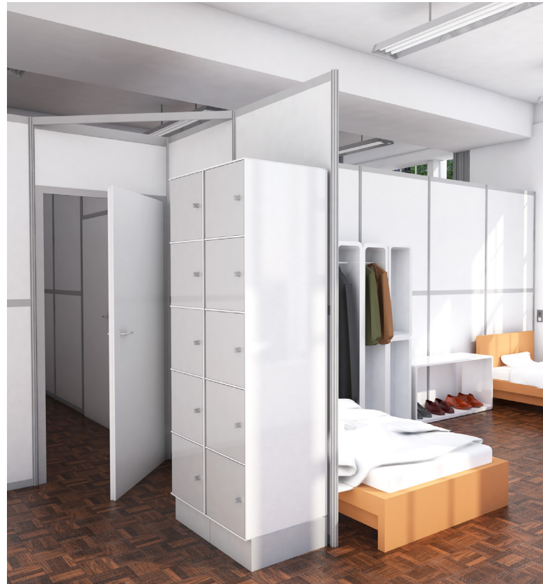
Nachher: Umbau in Wohneinheiten