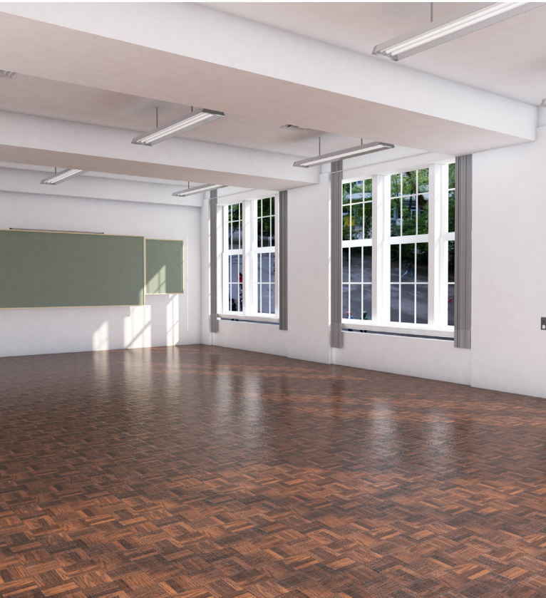
Vorher: Vorhandene Räumlichkeit